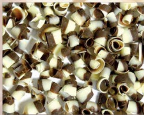
CEV-097 Pétale marbré Marbled Petal 4.5 kg