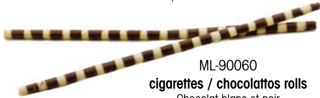
ML-90060 cigarettes / chocolattos rolls Chocolat blanc et noir White and dark chocolate