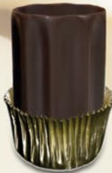
CEV-074 Hibiscus Chocolat noir / Dark Chocolate 154 unités/units 25mm x 38mm