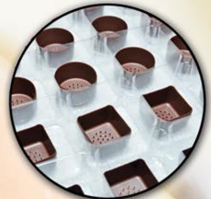
ML-90728 Coupe bonbon Candy Cup 200 un. 1" x 1"