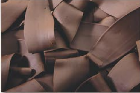
ML-90139 Éclat noir Dark Swirls 4 lbs