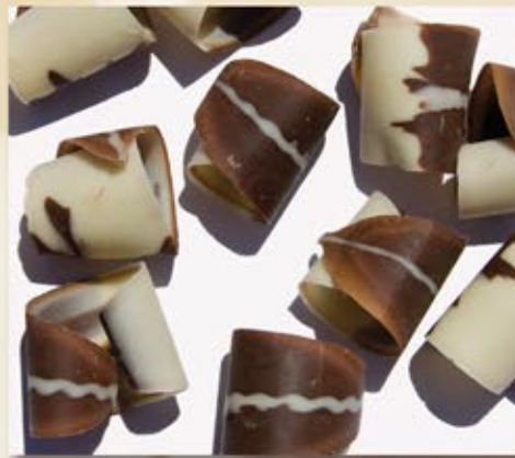
ML-90124 Éclat roulé marbré Marbled Curled Shaving 5 lbs