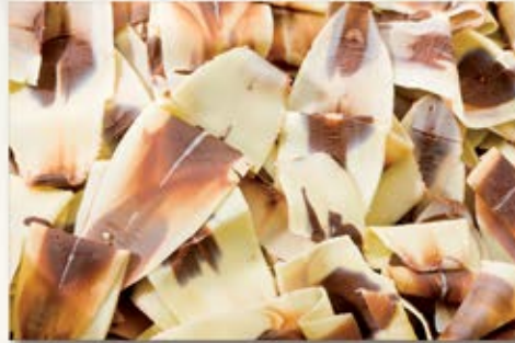
ML-90325 Éclat marbré Marbled Swirls 4 lbs