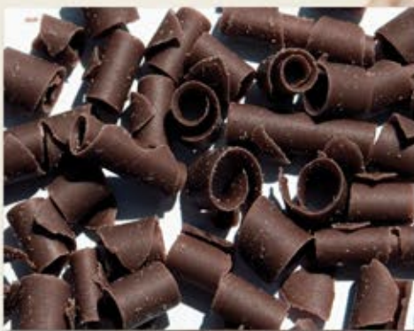
CEV-096 Pétale chocolat noir Dark Chocolate Petal 4.5 kg