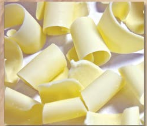
CEV-089 Éclat roulé blanc White Curls 2.25 kg