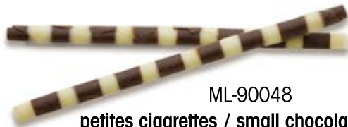
ML-90048 petites cigarettes / small chocolattos rolls marbré Marbled