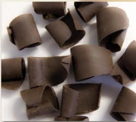
ML-90116 Éclat roulé noir Dark Curled Shaving 5 lbs