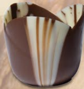
CEV-077 Mini Flora Marbré / Marbled 152 unités/units 34mm x 37mm