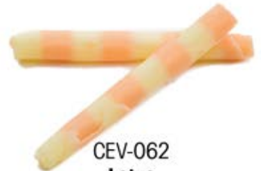
CEV-062 Lotus Chocolat blanc (ligné pêche) White Chocolate (Peach Stripes)