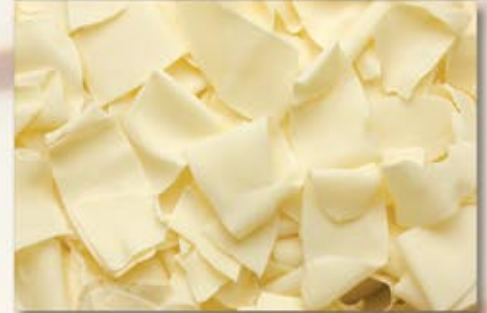
ML-90502 Éclat blanc White Swirls 4 lbs