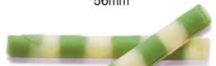
CEV-063 Aralia Chocolat blanc (ligné vert) White Chocolate (Green Stripes)