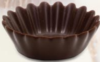
CEV-069 Mini Capucine Chocolat noir / Dark Chocolate 210 unités/units 13mm x 40mm