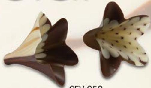
CEV-052 Lantana Marbré / Marbled 24 unités/units 50mm x 54mm