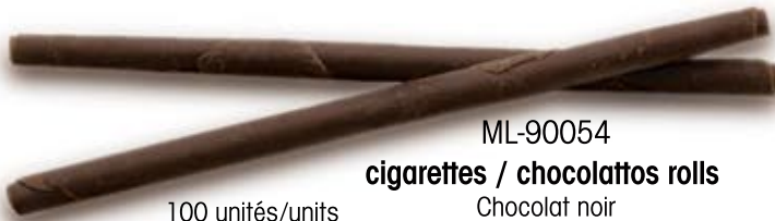
ML-90054 cigarettes / chocolattos rolls Chocolat noir Dark Chocolate