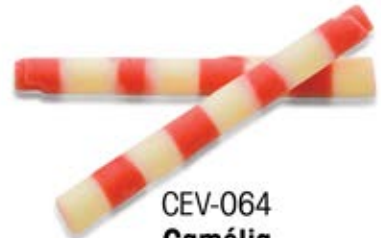
CEV-064 Camélia Chocolat blanc (ligné rouge) White Chocolate (Red Stripes)

Sucré, salé... à vous de créer! Sweet & Savoury... your Creation!